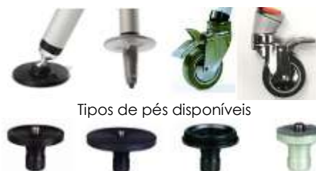
Tipos de pés disponíveis